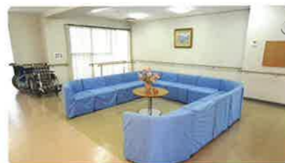
■ 談話コーナー (2階・4階)