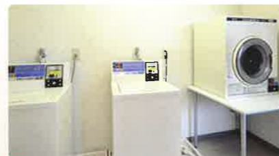
■ 洗濯室 (各階あり)